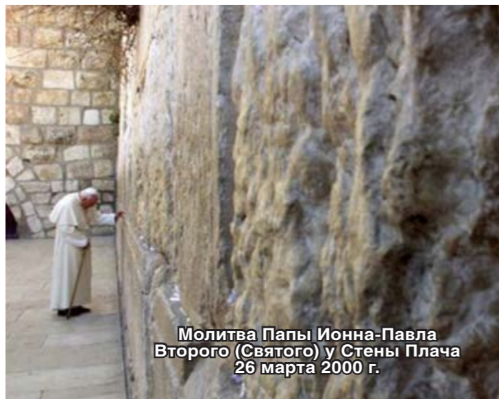
Молитва Папы Ионна-Павла Второго (Святого) у Стены Плача 26 марта 2000 г.