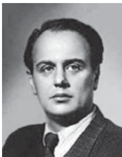
Евгений Аронович Долматовский