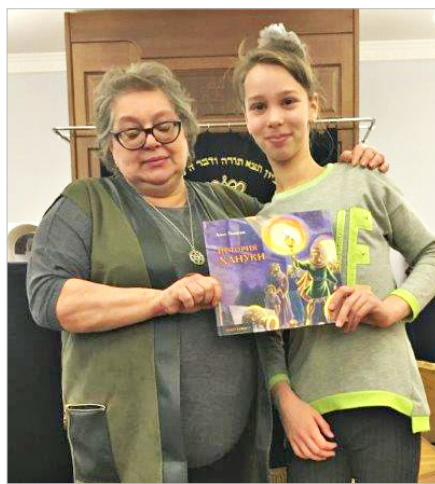
Самые активные получили приз – книгу История Хануки