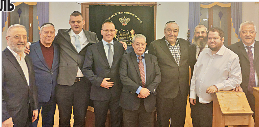
Гости из Тель-Авивского Института Жаботинского на экскурсии в синагоге