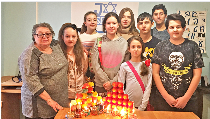
Вот такую ханукию из обычных яичных коробок и стеклянных банок мы сделали с детьми в преддверии праздника.